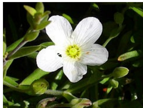
Detalle de la flor