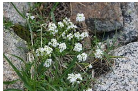
En su hábitat de montaña